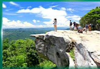
จุดชมวิวดงสุภาแผ่นดิน