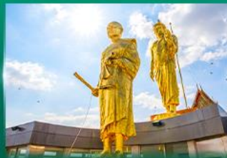
หลวงพ่อคูณ วัดบ้านไร่