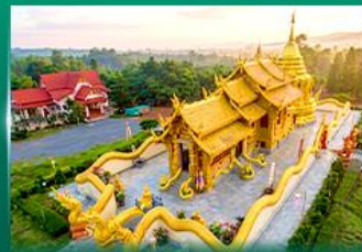
วัดเทพนิมิตประดิษฐ์