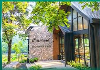
บ้านสวน สอนสวย 168