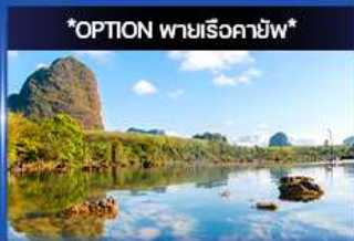
คลองหุด (คลองน้ำใส)