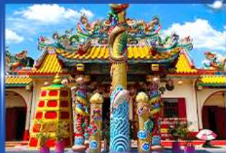
วัดศาลเจ้าท่ามังกงเยี่ย