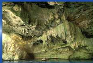
ถ้ำเภาทอง Unseen Thailand