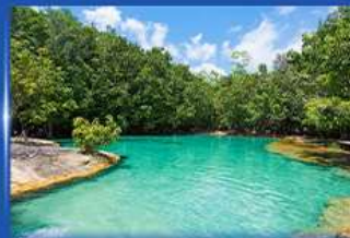
สระมรกต กระบี่