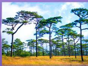
ลานสนกุสอยดาว