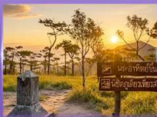
ชมพระอาทิตย์ขึ้น กุสอยดาว