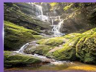
น้ำตกสายทิพย์