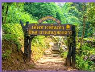
พีช 5 เป็นวัดใจ