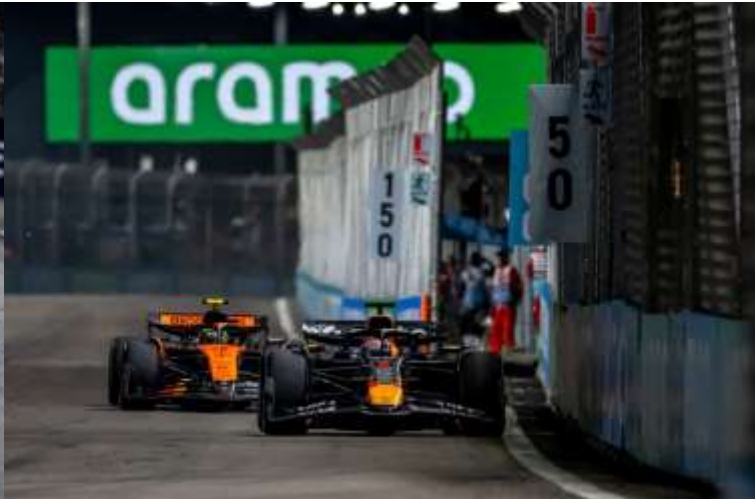
ชม รอบ SPRINT RACE + QUALIFYING