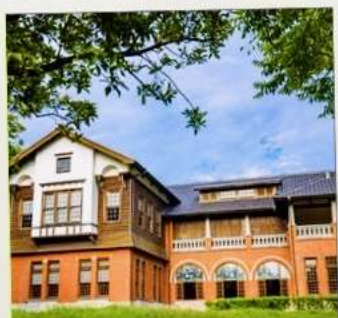
พิพิธภัณฑน์น้ำพุร้อนเป่ย์โถว