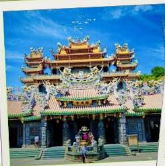
วัดกวนตุ๋