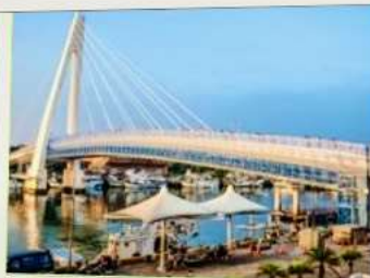
สะพานคู่รักตั้นสุ่ย