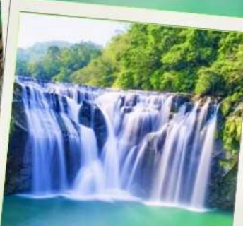
น้ำตกซือเฟิ่น