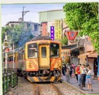
สถานีรถไฟซือเฟิ่น