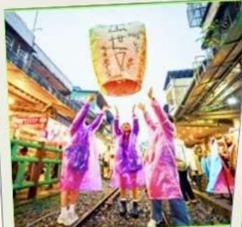
ปล่อยโคมลอย