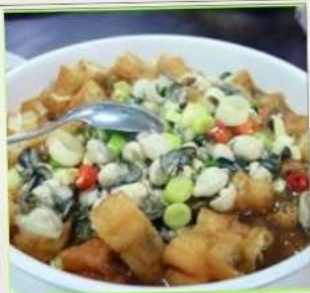
ถนนโบราณซือเฟิ่น