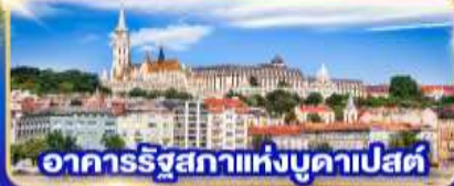
อาคารรัฐสภาแห่งบูดาเปสต์