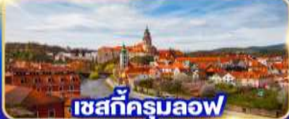
เซสท์ครุมลอฟ