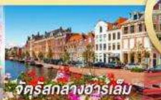
จัตุรัสกลางฮาร์เล็ม