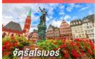
จัตุรัสสโมธอร์