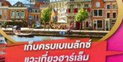
เก็บครบเบเนลักซ์ และเที่ยวฮาร์เล็ม