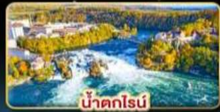
น้ำตกไรน์