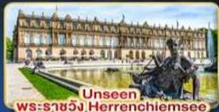
Unseen พระราชวัง Herrenchiemsee

บรรยากาศแสนโรแมนติก เส้นทางแห่งความฝัน พิชิต 2 ยอดเขา 2 ประเทศ TITLIS • ZUGSPITZE