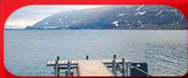
ทะเลสาบเบริงพซ์