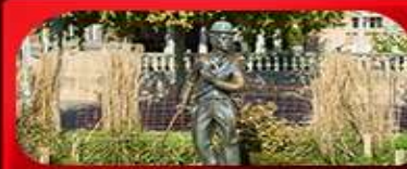
ชาร์ลี แชปลิน