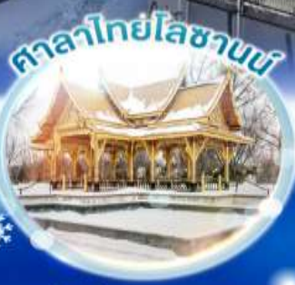
ศาลาไทยโบราณ