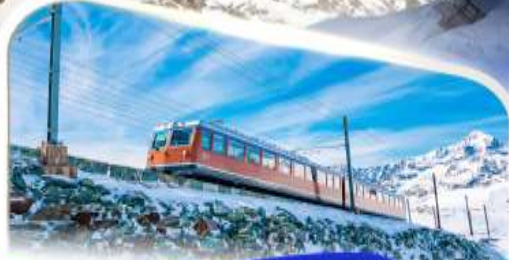
ขบวนรถไฟฟันเฟืองก่อนนอร์แอด