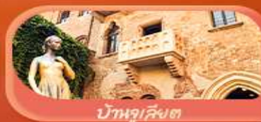
บ้านจูเลียต