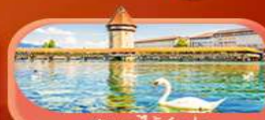
สะพานไม้ซังปก

Highlight เยือนหมู่บ้านแสนสวยเซอร์แมท เช็กอินศาลาไทยสุดงามที่โลซาน เที่ยวลูเซิร์น ชมสะพานไม้ซังและอนุสาวรีย์สิงโต ซาลี แอปสทิน ชมประติมากรรม The Fork และปราสาทซิลลองริมทะเลสาบ เยือนมิลาน มหาวิหารดูโอโม เกี้ยวเวนิส เมืองลอยน้ำสุดโรแมนติก อินกับรักอมตะที่บ้านจูเลียต และช้อปปิ้งจุใจที่ Serravalle Outlet