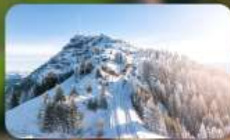
พิชิต 3 ยอดเขาดัง Rigi / Schilthorn / Gornergrat