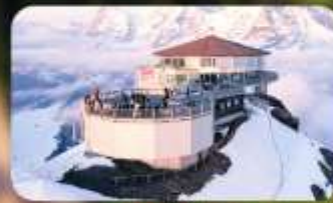
ทานอาหารที่ Piz Gloria ภัตตาคารที่หมุนได้ 360 องศา