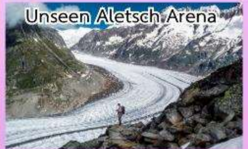
Unseen Aletsch Arena