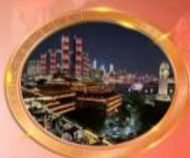
มือตำร้านอาหารริวหลีกส์ล้าน