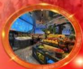
มือพิเศษ บุฟเฟต์นานาชาติ