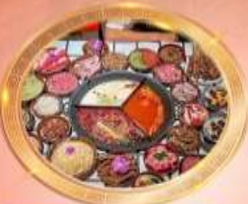
บุฟเฟต์หมีโพล่งซิ่ง