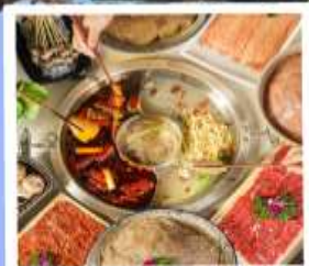
หม้อไฟหมาล่า