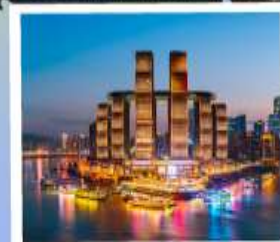
ตึกรูปเฟี๊