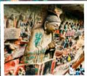
พาหิณแกะสลักต้าจู้