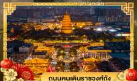
ถนนคนเดินราชวงศ์ถัง