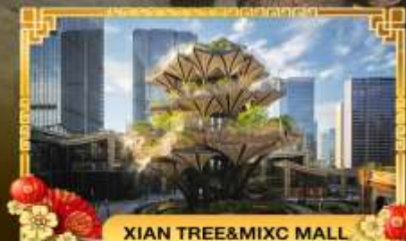
XIAN TREE&MIXC MALL