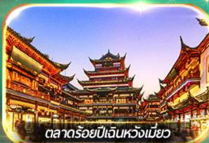
ตลาดร้อยปีเดินหวังเหมียว