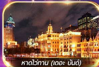
หาดว๋าทาน (เดอะ บันด์)

เที่ยวดิสนีย์แลนด์เต็มวัน (รวมรถรับ-ส่ง)