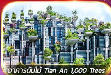
อาคารต้นไม้ Tian An 1,000 Trees