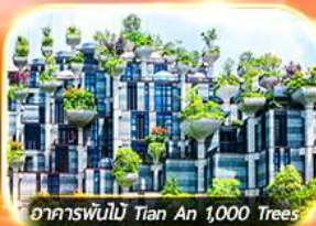
อาคารพันไม้ Tian An 1,000 Trees