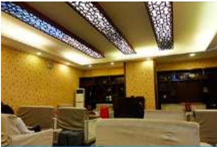
ศูนย์แพทย์แผนจีน

พักที่ HANTING HOTEL ระดับ 4 ดาวท้องถิ่นหรือเทียบเท่าในเมืองจางเจียเจี๋ย