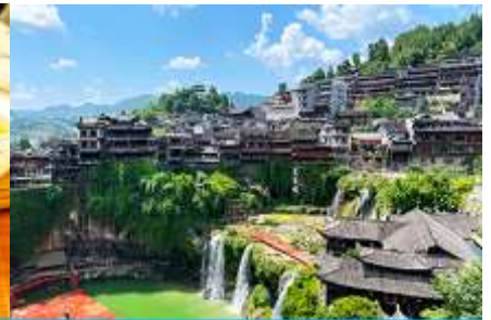
เมืองโบราณผู่หมิงเจี๋ย

วันที่สาม เมืองจางเจียเจี๋ย-ศูนย์แพทย์แผนจีน-ศูนย์จำหน่ายผลิตภัณฑ์ไชชา-ไกด์นำเสนอ OPTIONAL TOUR สะพานกระจกแกรนด์แคนยอน-เมืองโบราณผู่หมิงเจี๋ย