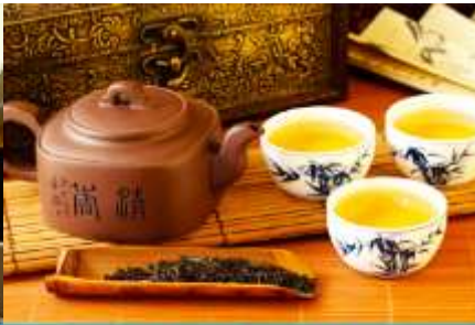
ศูนย์จำหน่ายผลิตภัณฑ์ไชชา