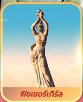
พีชเซอร์เก็รล