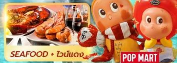
SEAFOOD + ไวน์แดง