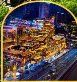
ตลาดหงหยาดัง