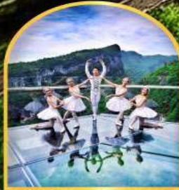
ระเบียบงิ้วอุหลอง