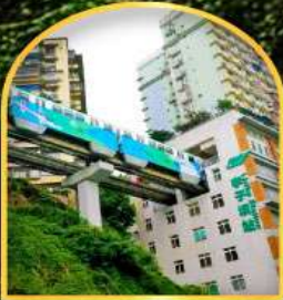
สถานีสกรไฟท์-ลูคัก