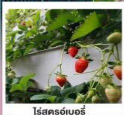
ไร่สตอร์รี่