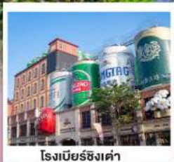
โรงแรมชิงเต่า