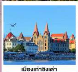
เมืองท่าชิงเต่า

ละมุนกรุ๋นกลิ่นสตอร์รี่ เบียงไถ เว่ยไห่ จีหนาน