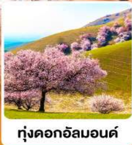
ทุ่งดอกอัลมอนต์