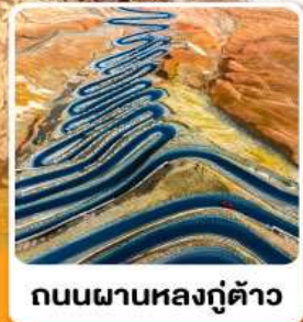
ถนนผานหลงตู้ต้าว