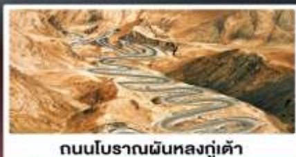
ถนนโบราณผืนหลงกู่เต้า