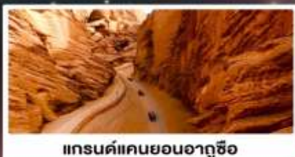
แกรนด์แคนยอนอาถูซือ