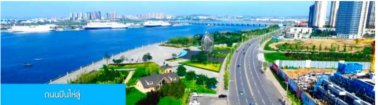
ถนนปินไห่หลู่