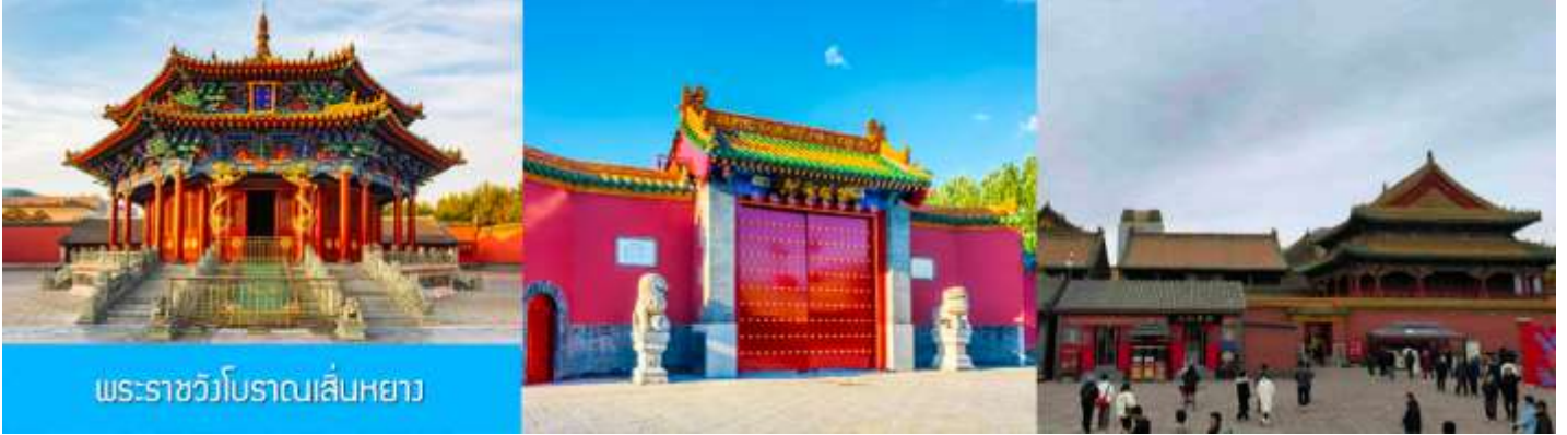
พระราชวังโบราณเสิ่นหยาง