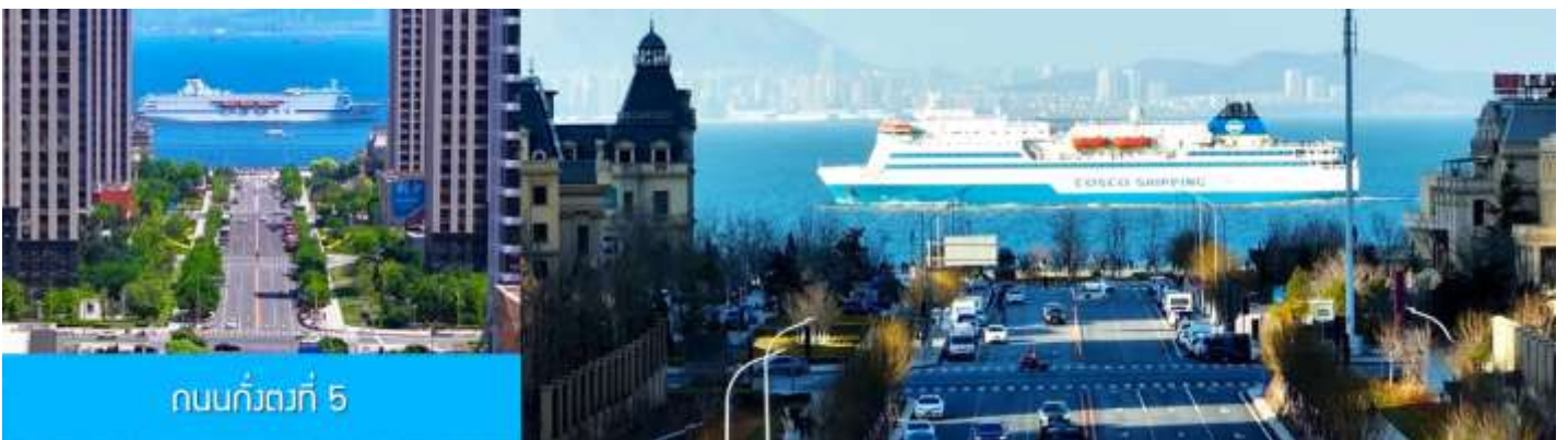
ถนนกั๋วตงที่ 5

หลังอาหารนำท่านเที่ยวชม ถนนกั๋วตง 5 港东五街 จุดเช็คอินใหม่ที่ได้รับความนิยมอย่างสูงจากนักท่องเที่ยว