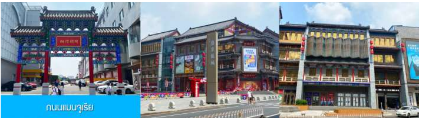
ถนนแมนจูเรีย