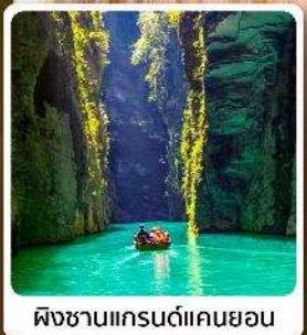
ผิงซานแกรนด์แคนยอน