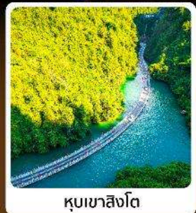
คุบเขาสิงโต

โอโห้! ปีนตรงลงเอินซือ ที่ยาวเอินซือเน้นๆจัดเต็มทั่วเมือง คุบเขาสิงโต ผิงซานแกรนด์แคนยอน อุกยานจีนสี่ซ่าน