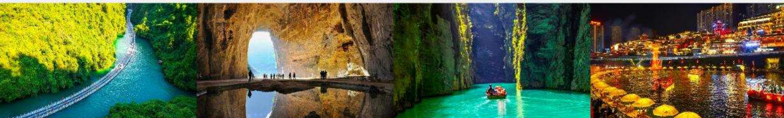
หุบเขาสิงโต