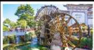
เมืองโบราณลี่จียง

ถนนเก่าคุณมิ่ง - ถนนสายดอกศรียี่ต้ง หุบเขาพระจันทรลีน้ำเงิน - ภูเขาหิมะมิงกรหยก เมืองโบราณลี่จียง - ทะเลสาบเอ๋อไห่ สวนน้ำตกคุณมิ่ง - รถมอเตอร์ไซด์