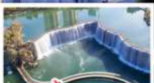
สวนน้ำตกคุณมิ่ง