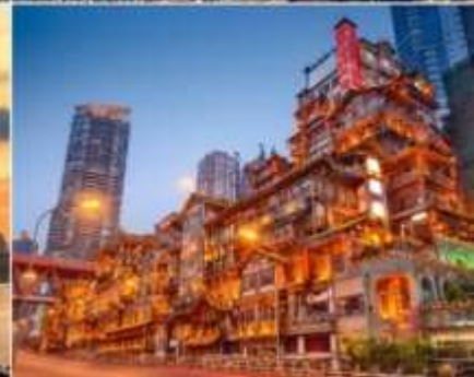
อิสระอาหารค่ำ ตามอรรถยาศัย