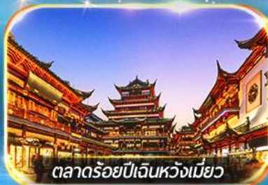
ตลาดร้อยปีเงินหวงเมียว

ถ่ายรูปชมสวนนอร์มัลด์ , เขคอินหาโต่วทาน, วัดพระหยกขาว อิสระช้อปปิ้งถนนนานกิง POPMART FLAGSHIP STORE