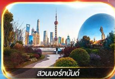
สวนนอร์มัลด์