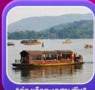
"ล่องเรือทะเลสาบซีหู"