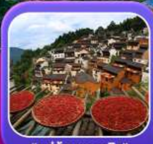
"หมู่บ้านทองหลิง"

หุบเขาเทวดาฉงเซี่ยนถู่ หมู่บ้านที่ตั้งอยู่ริมหน้าผา • หมู่บ้านโบราณทองหลิง ป่าสนน้ำชิงซาน • ล่องเรือทะเลสาบซีหู • ถนนโบราณตุ๋จื่อ • ชมแสงสีที่ อุ๋หนี่โจว