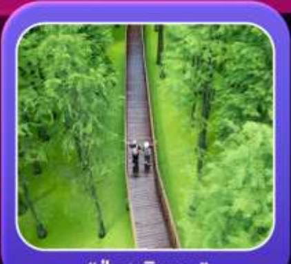
"ป่าสนชิงซาน"