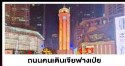
ถนนคนเดินเจียฟางเป็ย