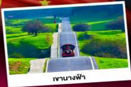
เขานางฟ้า

อุทยานหลุมฟ้าสามสะพานสวรรค์ มรดกโลกเขานางฟ้า ซุปบึงถนแดนเดิน