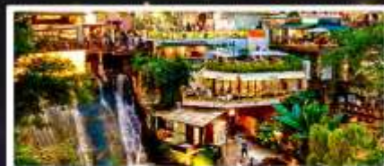
ถนนโบราณหลงเหมินฮ่าว