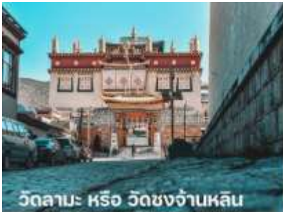
วัดลามะ หรือ วัดชงจ้านหลิน

นำท่านชม วัดลามะ หรือ วัดชงจ้านหลิน (รวมรถอุทยาน บริการรับ-ส่ง จุดจอดรถอุทยานไปส่งยังจุดทางเดินขึ้นวัดลามะ) สร้างขึ้นในสมัยราชวงศ์ซิง มีพระลามะจำพรรษาอยู่มากกว่า 700 รูป วัดแห่งนี้ห่างจากเมืองจางเตี้ยนไปทางเหนือประมาณ 5 กิโลเมตร มีการสร้างในลักษณะจำลองแบบจากพระราชวังโปตาลา (Potala) ในกรุงลาซา (Lhasa) และนอกจากนี้ยังเป็นวัดนิกายลามะแบบธิเบตที่ใหญ่ที่สุดในมณฑลยูนนานซึ่งมี อายุที่เก่าแก่กว่า 300ปี และในช่วงเทศกาล ชาวทิเบตส่วนใหญ่ ก็จะนิยมการเต้นระบำหน้ากากและเป่าแตรงอนซึ่งเป็นการละเล่นที่อยู่ ในช่วง เทศกาล สำคัญต่างๆของวัด รวมถึงประเพณีต่างๆ ที่ชาวทิเบตได้อนุรักษ์ไว้ ณ วัดชงชานหลินแห่งนี้ นำท่านเดินทางสู่ ลี่เจียง เป็นเมืองที่ตั้งอยู่ทางตะวันตกเฉียงเหนือของมณฑลยูนนาน ประเทศจีน ลี่เจียงเป็นเมืองโบราณสวยงามและมีประวัติศาสตร์ยาวนานกว่า 800 ปี จึงได้รับขึ้นทะเบียนเป็นมรดกโลกจากองค์การยูเนสโก (UNESCO) เมื่อปี ค.ศ. 1977 ให้เป็นมรดกโลกทางวัฒนธรรม