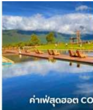
ค่าเฟ่สุดฮอต COFFEE YUN DI AN