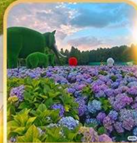
ดอกไม้ตามฤดูทงกา