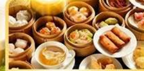
อาหารกวางตุ้ง