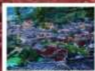
หมู่บ้านแม่วชิเจียง