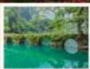
อุทยานเสี่ยวซีโขง