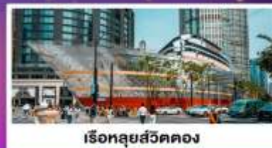
เรือทูลุยส์วิตคอง