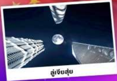
สูงเจ็ดยี่สิบ