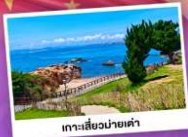
เกาะเลี้ยวม่ายเต่า

เที่ยวชิงเต่า เมืองทะเลสุดชิล ครบทั้งกิน เที่ยว ถ่ายรูป