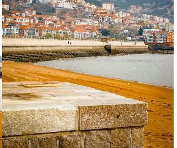
คล้ายคลึง