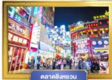
ตลาดชิงหยวน