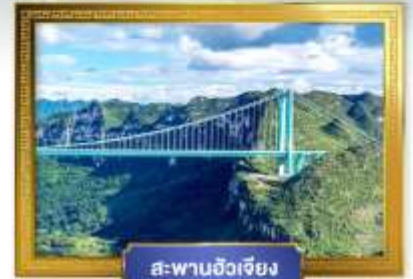
สะพานฮัวเจียง