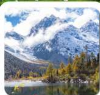
"ปี้เผิงโกว"

ชมความงาม 2 อุทยาน • สี่ฤดูนี้ • หวงเฉียวโกว • ปี้เผิงโกว • พระใหญ่เล่อซาน สะพานหมานเจียว น้ำตาสีฟ้า • ห้องสมุดสุดเก๋ จงซูเก๋ • แพนด้ายักษ์บนจอมเขาสี ชอยกัวจางชอยแคม • ถนนคนเดินซุนชี่สือ • แพนด้ายักษ์บนปีนดึก • ถนนคนเดินจินหลี่