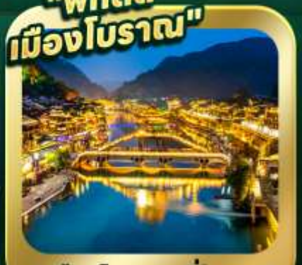
"เมืองโบราณเฟิ่งหวง"