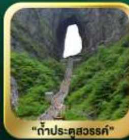
"กำประตูละออ"