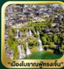
"เมืองโบราณฟูหลงจิ้น"