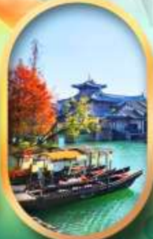
เมืองโบราณผู้หยวน