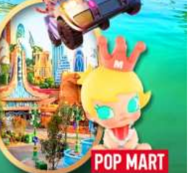
เลือกซื้อทัวร์เสริม เซี่ยงไฮ้ ดิสนีย์แลนด์