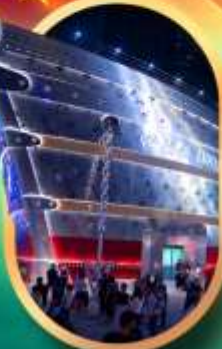
เรือคอะหลุยส์