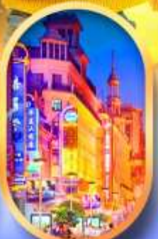
ถนนหนานกิง