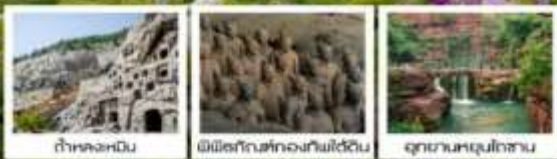
ถ้ำหลงเหมิน