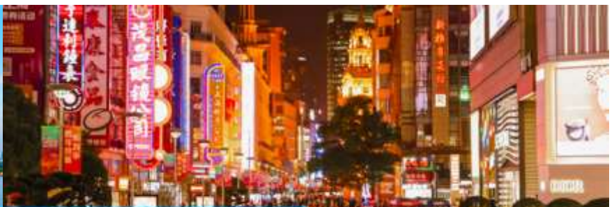
ถนนคนเดินหนานจิงจู่

จากนั้นนำท่านเดินทางสู่ ย่านช้อปปิ้งที่ใหญ่และคึกคักที่สุดของมหานครเซี่ยงไฮ้ ถนนคนเดินหนานจิงจู่ 南京路步行街 ให้ท่านเพลิดเพลินกับการเดินเที่ยว ชม และ ช้อปปิ้ง ชิมอาหารหรือของท่านเล่นอย่างจุใจ ในย่านถนนคนเดินนี้ นอกจากร้านค้าสินค้าแบรนด์เนมจากต่างประเทศแล้ว สินค้าแฟชั่น และสินค้าแบรนด์