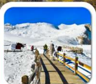
"ต่ากุกลาเชียร์"

เที่ยวชมความงาม 3 อุกยานชื่อดัง : สี่ดรุณี • ปี่เผิงโกว ต่ากุกลาเชียร์ ชมความน่ารักของหมีแพนด้า • จัดรสหยางเทียนวู้ ชอยกว้างชอยแคม • ถนนคนเดินซุนซีลู่ • POP MART