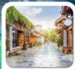
"ชอยกว้างชอยแคม"