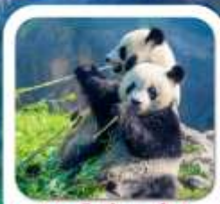
"ซุนยี่หมีแพนด้า"