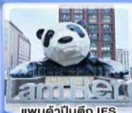
แพนด้าปิ่นตึก IFS