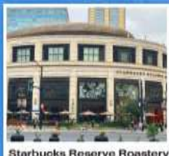
Starbucks Reserve Roastery