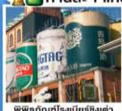
พิพิธภัณฑ์เบียร์ชิงเต่า